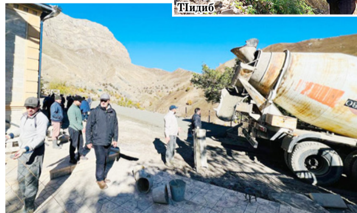
Бакълъухъ зияраталда аскIоб хъил тIолеб