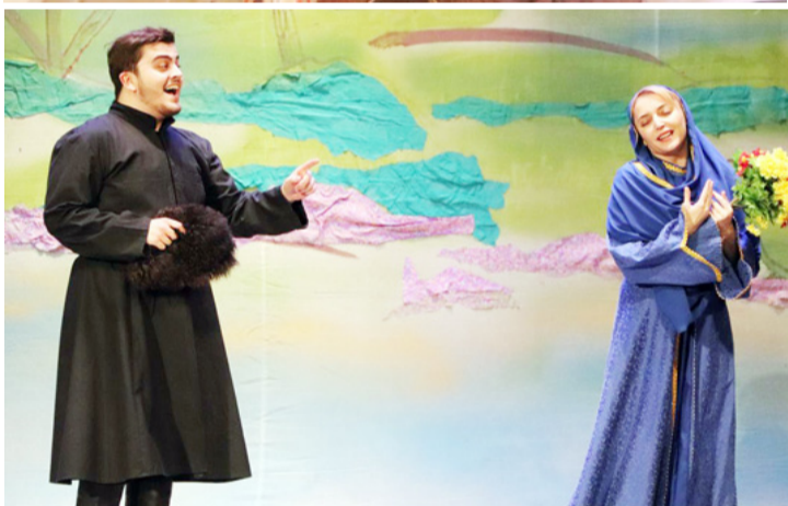
(Байбихи 1-себ гьум.)

Радал сагIат 10 тIубаралдаса нахъе къаси 8 тIубазегIан халатбахъараб фестивалалгьул программа букIана санайилго гIадин Авар театралгьул минаялгьуб. Гъениб жигараб гIахьалгьи гьабуна нилгьер районалгьул маданияталгьул хIаракатчагIаз ва «Цолгъи» газеталгьул коллективалъ.