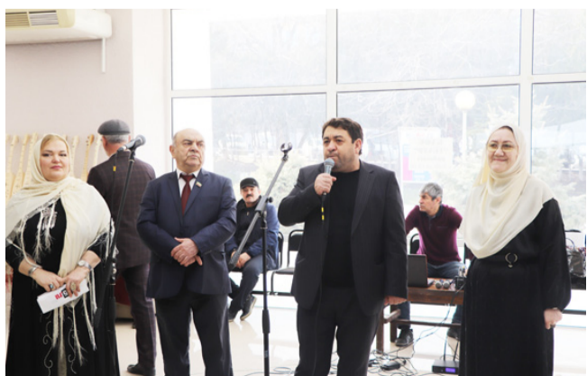
(Ахир 2-леб гъум.)

Араб шамат къоялъ Махлалъалаялда тлобитлана Халкъазда гъоркъосеб рахъдал мацлазул къоялде гулцараб тадбир - Авар мацлалълул 10-леб юбилеялълулаб фестиваль. Ахирияб клнго соналъ коронавирасулълул унти сабалълун гъабун буклинчло рахъдал мацлазул фестиваль. Гъель батила, цоцахъ цлалларал миллатцояз гларжаибаб хинлъигун ва рохелгун байбихъана данчлвай. Магларул миллияб ратлилъ руклана фестивалалде цварал гемеисел глархалчагин.