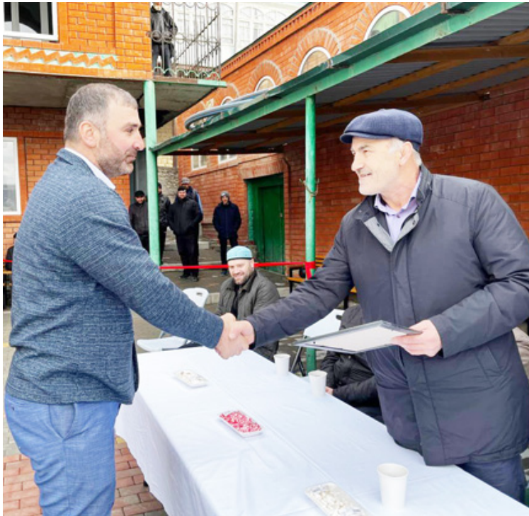
(Байбихь 1-себ гьум.)

Гьединго, майдан рагьулаго, ракибацIадаб ва мухIканаб хIалтIухъ, ООО «ДОРСПЕЦСТРОЙ» идараялъул нухмалгьулесе, гьезулго тIокIлгьи бихьизабурав хIалтIухъанасе ва Телекъа жамгIиял хIалтIабалъ жи-