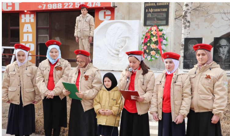
(Байбихъи 1-себ гъум.)

Полилазул ишазул бетерев специалист М.Хатиевас гюлилабитараб нухдаса инеккани, гъез жиндерго росдал, районалгул ва улкайгул тарих лъазабичара гъечелбгун букИн бицана, гъединго, баркала къуна тадбиралда гъахъаллгъарал цалдохъабаза ва мугъалимзабаза.