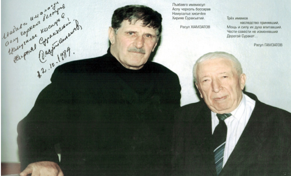
(Байбихъи 1-себ гьум.)