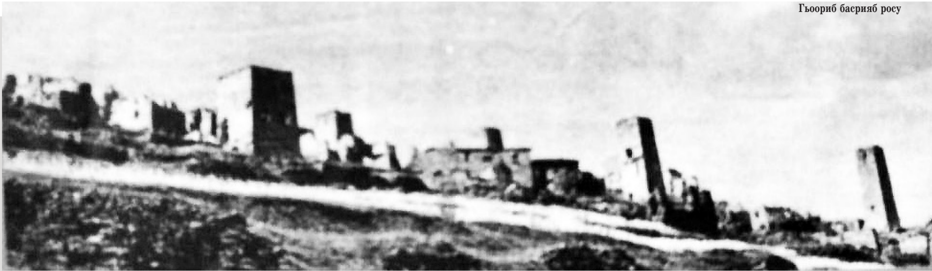
Гьoorиб басрияб росу