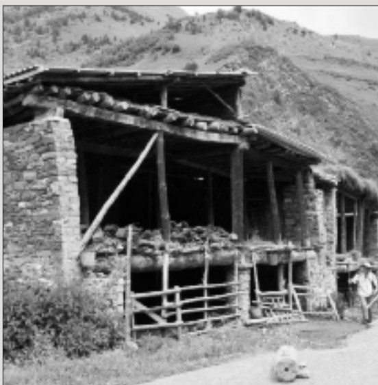
Рагъул заманалъ бачин цунулел рукъларал гъорал