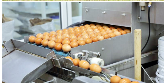
Отдел экономики МО «Шамилский район»