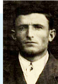
Кѳудияб Бергъенлъи ракѳалдещвеялъе

Хирамухѳамад Гѳалимухѳамадович - блокадаялълул гѳахъалчи