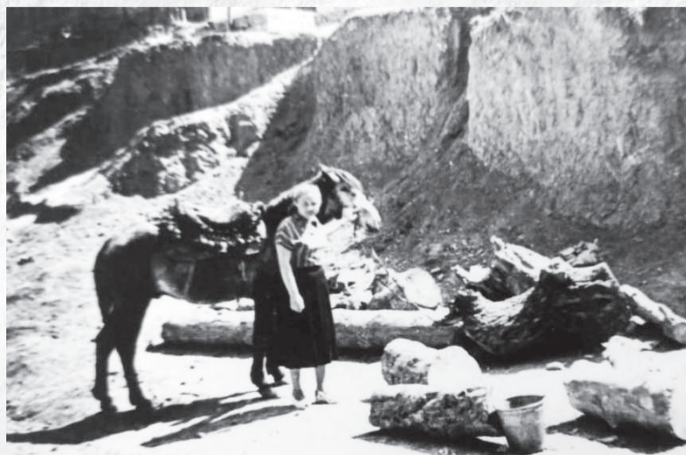
В командировке в Ругельда

Ученики тех лет очень серьезно, старательно учились, думая о том, что надо иметь специальность. Продолжу в следующем письме. До свидания!